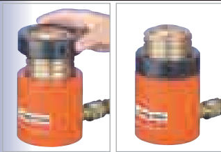
Locking collar feature permits non-hydraulic support of load.